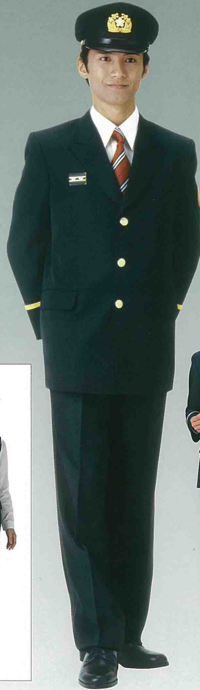
TK-3131 / TK-300